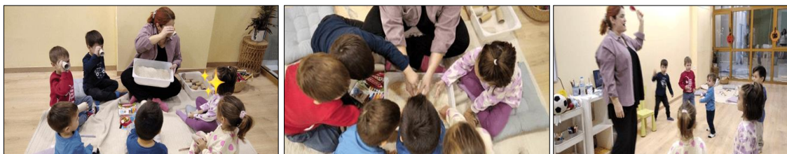
Εικόνα 7, 8 & 9. DIY Maracas

Οι μαθητές/τριες επεξεργάζονται με όλες τις αισθήσεις τα υλικά που έχει συγκεντρώσει ο/η εκπαιδευτικός, οξύνοντας τη φαντασία και τη δημιουργικότητά τους. Σε αυτή την εκπαιδευτική διαδικασία, τα παιδιά κατασκευάζουν μουσικά όργανα τα οποία στη συνέχεια χρησιμοποιούν συνοδεύοντας κινητικές δραστηριότητες.