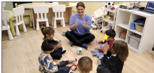
Εικόνα 14. The dice game

Μέσω του βιωματικού και παιγνιώδους τρόπου μάθησης επιτυγχάνεται η συνειδητοποίηση των μελών του σώματος, η ανεξαρτησία, ο έλεγχος και ο συντονισμός κινήσεων, καθώς επίσης και η ανάπτυξη κινητικών δεξιοτήτων και συγκέντρωσης.