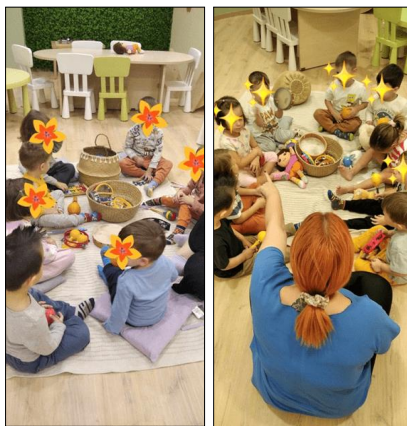
Εικόνα 1 & 2. Τραγούδι Καλωσορίσματος

Σε κυκλική μορφή τοποθετούνται τα κρουστά μουσικά όργανα ανάλογα με τον αριθμό των μαθητών/τριών. Οι μαθητές/τριες κάθονται ανάλογα και ενθαρρύνονται να επεξεργαστούν ηχητικά το μουσικό τους όργανο. Ο/Η εκπαιδευτικός ξεκινά με σταθερά ρυθμικά χτυπήματα στο κρουστό του το “Welcome song”, προσπαθώντας να συγχρονιστεί ρυθμικά και η ομάδα και μαζί συνοδεύουν λεκτικά και ρυθμικά χαιρετώντας τον καθένα χωριστά.