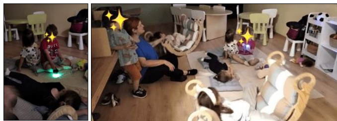
Εικόνα 3 & 4. Χαλάρωση

Τα μαθήματα περιλαμβάνουν ηχοιστορίες, ρυθμική αγωγή, βιωματικά παιχνίδια όπως παιχνίδια πάνω σε μουσικές έννοιες, οργανογνωσία ή με σχέση το γνωστικό αντικείμενο διδασκαλίας, project καθώς και μουσικοκινητικές δραστηριότητες. Παρακάτω, θα αναλυθούν παραδείγματα των δραστηριοτήτων αυτών ως προς την μορφή, το περιεχόμενο και τη διδακτική χρήση.