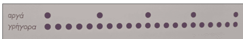
Εικόνα 6. Ενδεικτική γραφική απεικόνιση

Με τον ίδιο τρόπο, σε άλλο χαρτί, παίζει τύμπανο fast and slow και προτρέπει να «περπατήσουν» με τα πινέλα με τις μπογιές πάνω στο χαρτί αποτυπώνοντας τους ήχους. (ακουμπούν τη πινέλο στο χαρτί κάθε φορά που ακούν τον ήχο για όση ώρα διαρκεί).