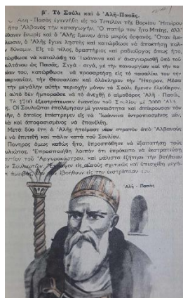
Εικόνα 3. Εικόνα από το εσωτερικό του βιβλίου

Εκείνο που είναι κοινό με τα προηγούμενα σχολικά βιβλία είναι η αναφορά στον ρόλο της Εκκλησίας στη διατήρηση του Ελληνικού Έθνους. Είναι γνωστό ότι στη διαδικασία συγκρότησης της ελληνικής εθνικής συνείδησης η θρησκεία αποτέλεσε ένα από τα βασικά στοιχεία. Δεν είναι τυχαίο ότι στον «Οργανισμό του Αρείου Πάγου» το συνταγματικό κείμενο του 1 ου έτους της επανάστασης «Έλληνας» ήσαν «όσοι κάτοικοι της Ελλάδος πιστεύουσιν εις Χριστόν». Η Χριστιανική πίστη αποτελούσε κριτήριο μείζονος σημασίας για τη διάκριση και τον προσδιορισμό των Ελλήνων και του πολιτικού έθνους τους αλλά ήταν επίσης κριτήριο αποκλεισμού ορισμένων κατοίκων της ελληνικής επικράτειας από το δικαίωμα του πολίτη (Βόγλη, 2007: 47-48).