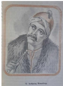
Εικόνα 4. Σελίδα από το εσωτερικό του βιβλίου

Οι πρώτοι αυτοί διδάσκαλοι των υποδουλωμένων Ελλήνων, οι Ιερείς και οι Καλόγηροι, αν και είχαν πολύ μικράν μόρφωσιν, δεν περιωρίζοντο εις το να διδάξουν τα Ελληνόπουλα μόνον ολίγα «κολλυβογράμματα». Εκαλλιεργούσαν εις την ψυχήν των την αγάπην προς την Θρησκείαν, την Πατρίδα και την Ελευθερίαν. Αυτά ήσαν τα κρυφά σχολεία» (σελ. 30).