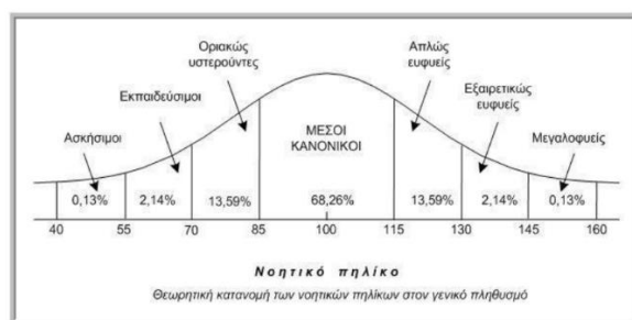
Εικόνα 1. Εκτίμηση νοητικού δυναμικού με σταθμισμένες ψυχολογικά κλίμακες.

Σύμφωνα με το DSM (American Psychiatric Association, 2013) και ICD, πρέπει να πληρούνται τρία κριτήρια για τη διάγνωση της νοητικής αναπηρίας [α] κάτω του μέσου όρου νοητική λειτουργία, [β] περιορισμοί σε δύο ή περισσότερους τομείς προσαρμοστικής συμπεριφοράς σε πολλαπλά περιβάλλοντα, όπως επικοινωνία, δεξιότητες αυτοβοήθειας, διαπροσωπικές δεξιότητες και [γ] στοιχεία ότι οι περιορισμοί έγιναν εμφανείς στην παιδική ηλικία ή στην εφηβεία. Η διάγνωση απαιτεί πλήρη αξιολόγηση της νοημοσύνης και της προσαρμοστικής συμπεριφοράς από διεπιστημονική ομάδα ειδικών επιστημόνων όπως είναι οι ψυχολόγοι, οι ειδικοί παιδαγωγοί, οι παιδοψυχίατροι, και άλλοι εξειδικευμένοι επιστήμονες στα θέματα της ΝΑ. Σύμφωνα με τον Χρηστάκη (2011: 155-214) η μέτρια και η σοβαρή νοητική αναπηρία διαγιγνώσκονται νωρίς, ενώ η ήπια νοητική αναπηρία γίνεται εμφανής στο δημοτικό σχολείο λόγω μαθησιακών δυσκολιών. Η διάγνωση της νοητικής αναπηρίας δε βασίζεται μόνο σε αριθμητικούς υπολογισμούς και βαθμολογίες δεικτών νοημοσύνης, αλλά λαμβάνει υπόψη την προσαρμοστική λειτουργία ενός ατόμου με την μεθοδολογία παρατηρήσεων των ειδικών εκπαιδευτικών αναγκών.