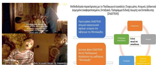
Εικόνα 3. Παιδαγωγική θεώρηση της ατομικότητας

Η αναγκαιότητα της ερευνητικής μελέτης τεκμαίρεται επίσης, στη βάση προγενέστερων ερευνών αναφορικά με το φαινόμενο της σεξουαλικής κακοποίησης παιδιών και εφήβων (Department of Children and Families (DCF), 2022). Αυτό που μέχρι πρόσφατα έμοιαζε εξορισμένο από τη σκέψη, σήμερα θεωρείται ότι υπάρχει, περιγράφεται, συζητείται (Stern, Lynch, Oates, O’Toole, & Cooney, 1995). Και ως κοινωνία, πολλές φορές μένουμε να κοιτάμε τρομαγμένοι την πραγματικότητα, όταν μάλιστα πρόκειται για κορίτσια με νοητική αναπηρία.