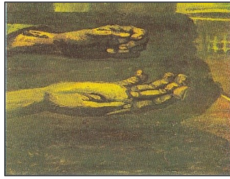
Εικόνα 11. Δύο χέρια , 1885, Ιδιωτική συλλογή, Νουενέν, Λαδομπογιά σε καμβά 29.5 x 19 cm