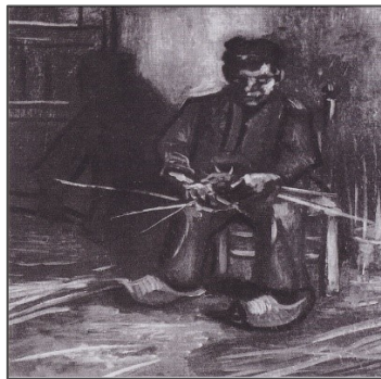
Εικόνα 8. Χωρικός φτιάχνει ένα καλάθι, 1885, Ιδιωτική συλλογή, Νουένεν, Λαδομπογιά σε καμβά, 41 x 33 cm