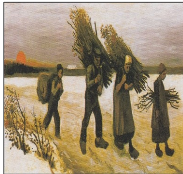
Εικόνα 3. Μαζεύοντας ξύλα στο χιόνι, 1884, ιδιωτική συλλογή, Νουένεν, Λαδομπογιά σε καμβά 67 x 126 cm