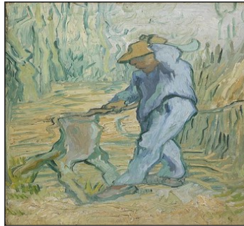
Εικόνα 2. Ο ξυλοκόπος, 1890, Μουσείο βαν Γκογκ Άμστερνταμ, Σεντ Ρεμύ, Λαδομπογιά σε καμβά 43.5 x 25cm