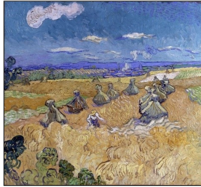
Εικόνα 7. Χωράφια σταριού και ο θεριστής, 1890, Μουσείο Τέχνης του Τολέδο, Ωβέρ-συρ-Ουάζ, Λαδομπογιά σε καμβά, 73.6 x 93 cm