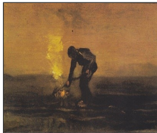
Εικόνα 9. Χωρικός καίει χόρτα, 1883, Μουσείο του βαν Γκογκ, Ντρέντε, Λαδομπογιά σε καμβά 30.5 x 39.5 cm