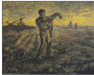
Εικόνα 12. Βράδυ: Στο τέλος της μέρας , 1889, Μουσείο Τέχνης Μερνάντ Ιαπωνία, Σεντ Ρεμού, Λαδομπογιά σε καμβά 72 x 94cm

Οι μαθητές εργάστηκαν με διαφορετικούς τρόπους, όπως γραπτά σε αρχείο word και σε αρχείο PowerPoint. Όσον αφορά το συναισθηματικό και το νοηματικό κομμάτι, οι μαθητές είχαν πολλές κοινές απαντήσεις και ερμηνείες, όπως: μίσος, πόνος, μελαγχολία, θλίψη, κούραση, στέρηση, ταλαιπωρία, φτώχεια, στέρηση, μοναξιά, κατάθλιψη. Η χειρωνακτική εργασία και η δύσκολη ζωή ήταν τα κοινά χαρακτηριστικά των έργων, τα οποία οι μαθητές διαπίστωσαν επιτυχώς.