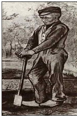
Εικόνα 6. Ο αγρότης που γέρνει στο φτυάρι του , 1881, Μουσείο Κρέλλερ-Μίλλερ – Οτερλό, Επτέν, Υδατογραφία