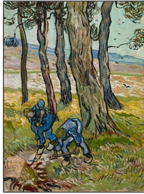
Εικόνα 4. Οι σκαφείς , 1889, Ινστιτούτο Τέχνης του Ντιτρόιτ, Σεντ Ρεμύ, Λαδομπογιά σε καμβά 65.1 x 50.2cm